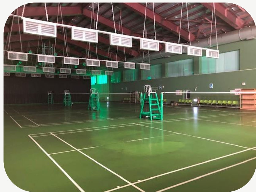
羽球場 排球場 籃球場